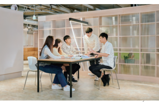
快適な学習スペース