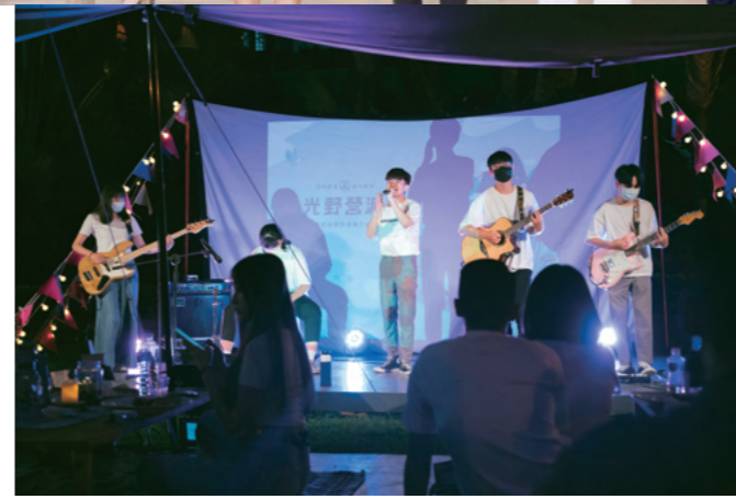
多様なクラブ活動

弘光科学技術大学は、あなたのビジョンが見つかるようガイドしてくれる大学です。多様な科目から選べるので、自分のさまざまな理想を実現させるチャンスがここにはあります。長年にわたり、「卒業したら就職できる」ことを見据えて、大量の資源を投入して教育内容を深め、最新の教育環境と設備を構築し、産業界の資源を広く確保してきました。あなたの夢は、もうただの夢ではありません。