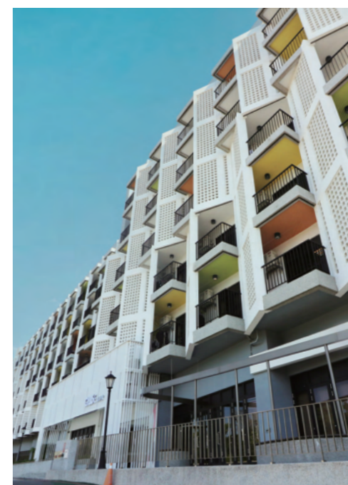
キャンパス内の生活機能が完備

多様で栄養バランスのとれた美味しい食事 デパートのフードコートのような学生食堂では、さまざまな食事を選ぶことができ、専門の栄養士が食事の衛生状態を監督指導して学生や教師全員が健康的な食事をとることができます。