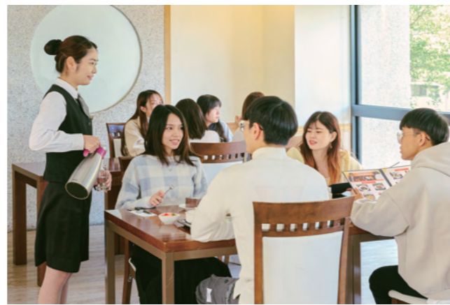
学生実習レストラン

弘光科学技術大学の全学科・昼間部の全学生は 100% 学内外のインターンシップに参加します。業界とシームレスにつながっているため、卒業生の就職率は9割を達成していることが、 卒業後すぐに就職できる ことを最もよく証明しています。