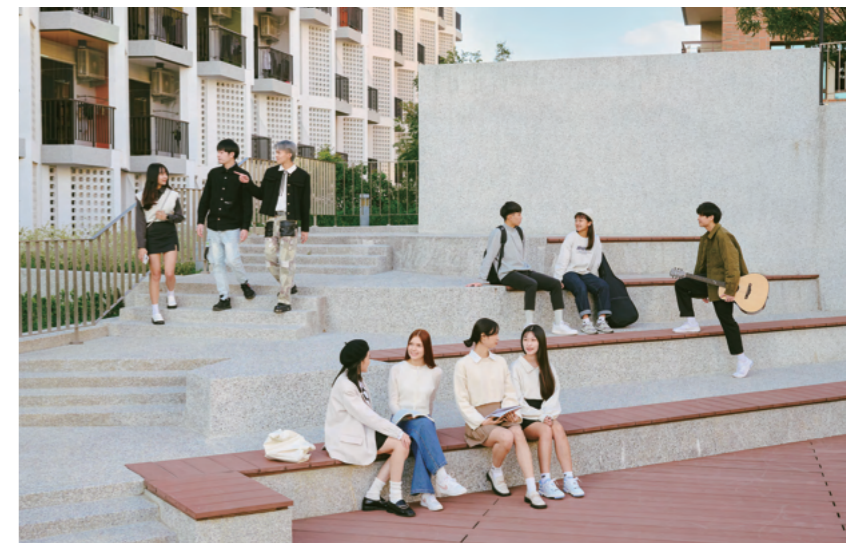
学生寮の外の広場