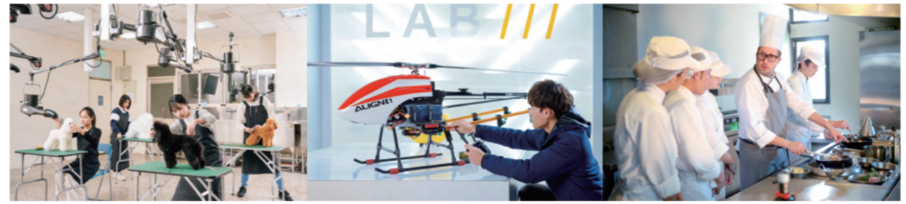
ペットグルーミング専業教室